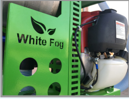
Global Maks Kalitesi